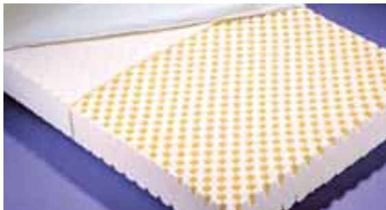
Medi-Ultra 10000 0931 200 X 75 X 12 см 10000 0933 200 X 85 X 12 см 12800 9933 205 X 80 X 12 см 12300 9913 166 X 80 X 12 см