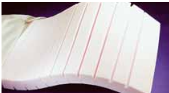
Medi-Flex-Tricot 10000 0937 200 X 75 X 13 см 10000 0938 200 X 85 X 13 см