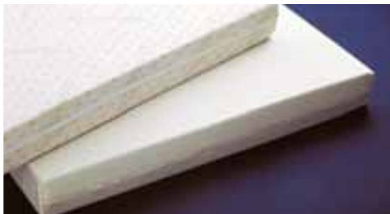
Medi-Tricot 10000 0935 200 X 75 X 10 см 10000 0936 200 X 85 X 10 см