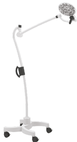
Mobilleuchte mit 2 antistatischen Laufrollen