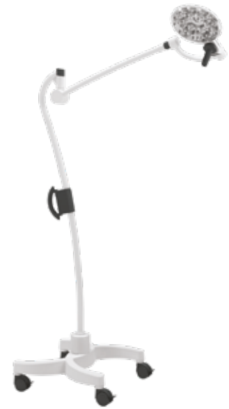
Mobil med 2 antistatiska hjul